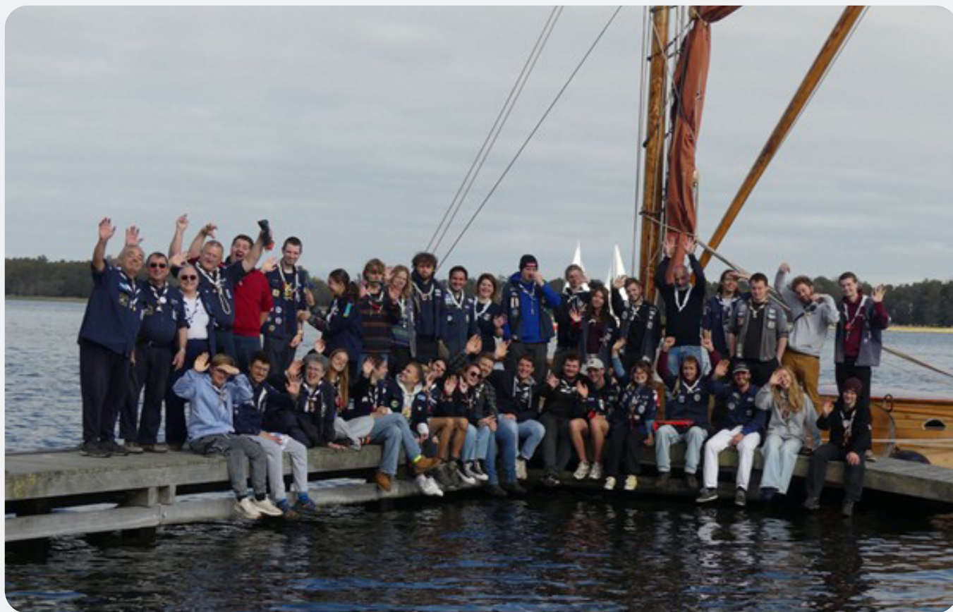
■ La Team Armada des Sea-Scouts et Sea-Guides 2025

L'ARMADA 2026 se déroulera les 25, 26 et 27 septembre 2026 au Scoutcentrum Zeeland.