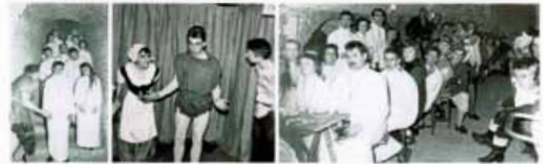
À la kermesse flamande...

Tarpan, Hérisson, Koala, Okapi, Kotick, Ourson, Sahi, Coq, Phaco, Tamanoir, Coati, Maky (fille), Agouti sont de l'aventure. Ils se présentent à la soirée en Bourgeois de Calais, la corde au cou. Une partie d'entre eux pré-