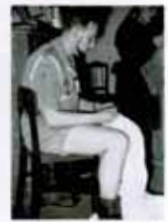
Point n'est besoin d'espérer pour entreprendre, ni de réussir pour persévérer.