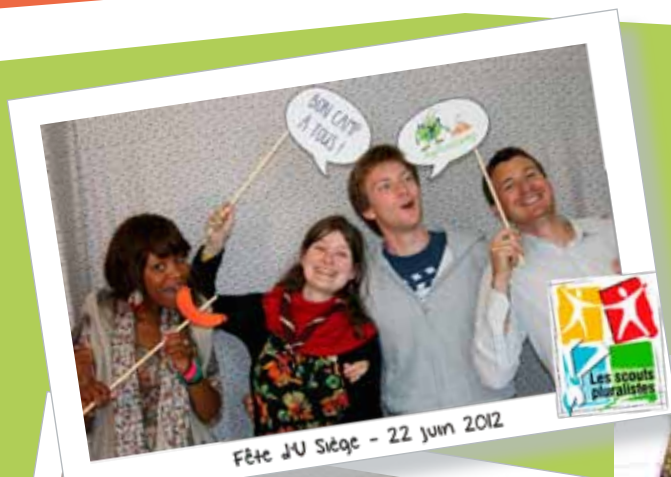
Fête d'U Siège - 22 juin 2012