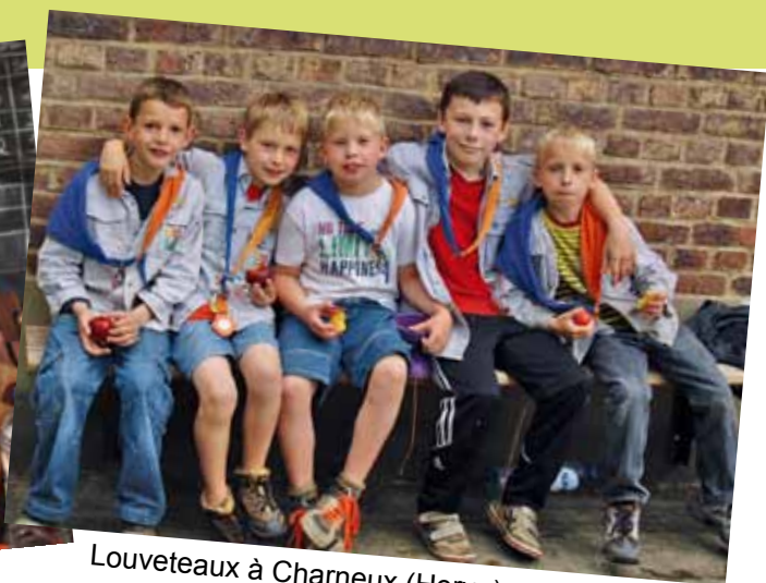
Louveteaux à Charneux (Herve)