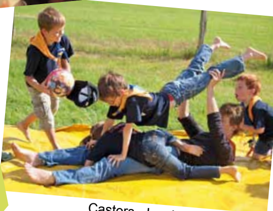
Castors - Les Vilettes