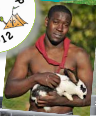
Le poulailler de la 250 e Troupe de Jamioulx !