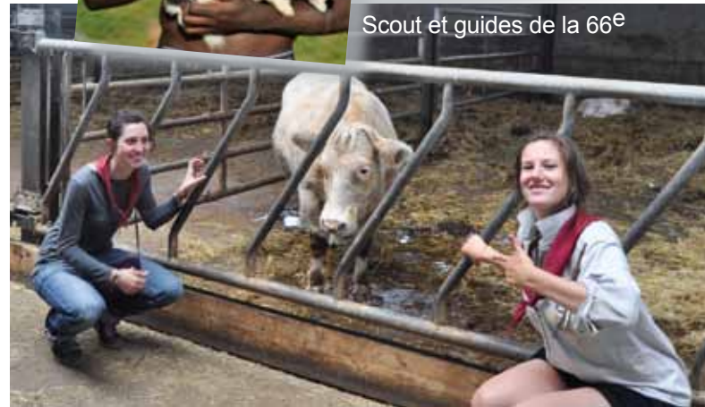
Scout et guides de la 66 e