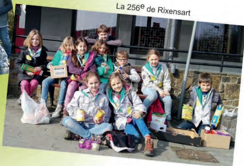
La 256 e de Rixensart

Et la 292 e de Braine-l'Alleud, la 22 e de Lillois, la 24 e de Jette.