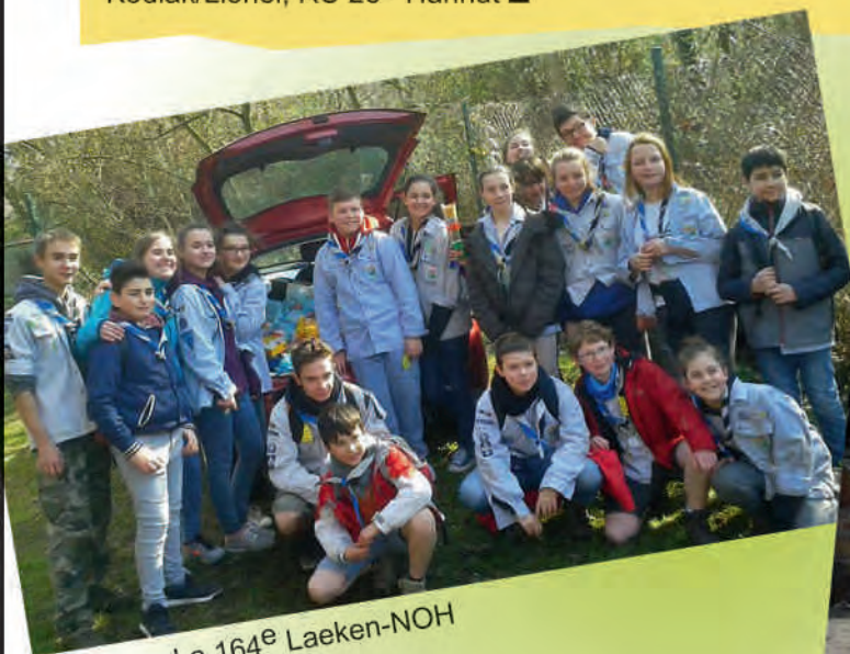
La 164 e Laeken-NOH

Plusieurs autres Unités ont participé à la récolte de vivres = 91,5 tonnes !