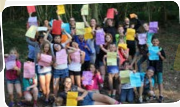
Kaa, animateur Meute